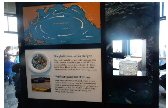
太平洋に散らばるマイクロプラスチック