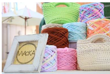
Tシャツからアップサイクルされた手芸糸